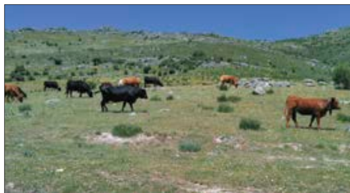
En Bruselas no comprenden cómo son los pastos de nuestra tierra.

marca la corrección financiera a las comunidades autónomas por incumplimiento de la normativa relativa al Coeficiente de Admisibilidad de Pastos (CAP) en las campañas 2010, 2011, 2012 y 2013. En concreto nuestra comunidad sería la tercera más afectada (57.945.425,36 euros), tras Extremadura, y Andalucía, aunque también perjudica a otras como Castilla-La Mancha, Cantabria, Murcia, la Comunidad Valenciana, Extremadura, La Rioja, Madrid y