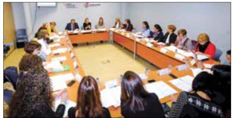
Última reunión de la Sección de Igualdad de Oportunidades, en la que participa ASAJA.

En el área de medio rural, el objetivo es apostar por la igualdad de género en el mundo rural, ya que el 40 % de las mujeres de Castilla y León residen en municipios de menos de 10.000 habitantes. Entre las actuaciones más destacadas de la 'Agenda para la Igualdad de Género 2020' en el área rural están las de establecer la titularidad compartida de las explotaciones agrarias como criterio prioritario en las ayudas del ámbito agrario; la puesta en marcha de programas de for-