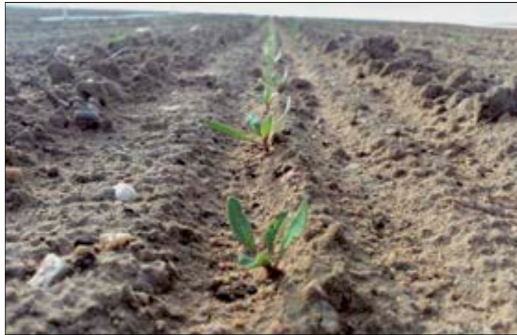
Remolacha recién nacida.

Los beneficiarios de estas ayudas firmarán un contrato comprometiéndose a cumplir los compromisos correspondientes a la medida durante un período de cinco años o campañas agrícolas consecutivas, a contar desde el primer año o campaña agrícola de reconocimiento de la incorporación a la medida.