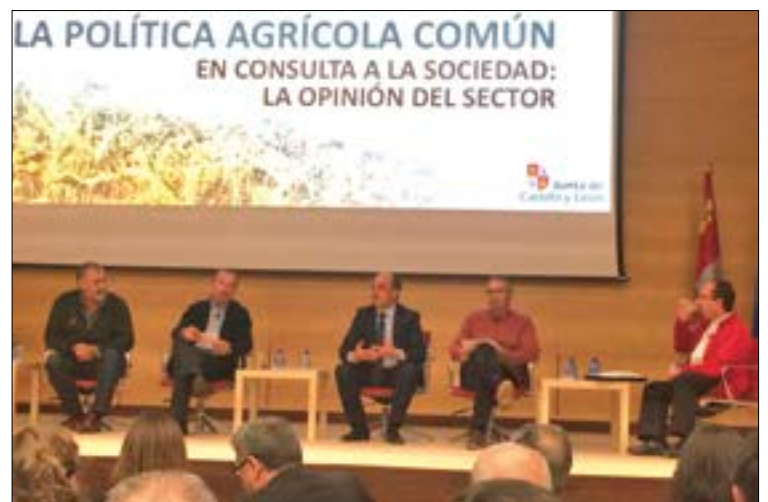
Jornada sobre la PAC celebrada en la Consejería de Agricultura y Ganadería.