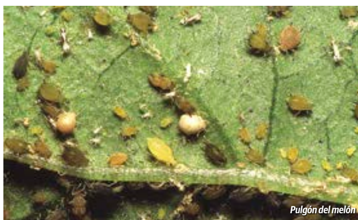
Pulgón del melón

mente para esta especie vegetal, consecuencia de que forman parte de la misma familia botánica. No obstante algunas de ellas inciden en mayor medida sobre este cultivo. Tal es el caso de la mosca blanca de los invernaderos , de los pulgones (transmisores de virosis) y de la araña roja .