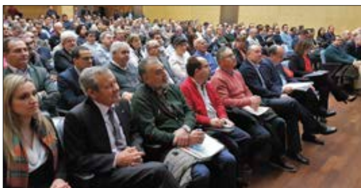
Lleno en el salón de actos de la Consejería de Agricultura y Ganadería.

Ha indicado que, tras la consulta abierta por la Comisión,