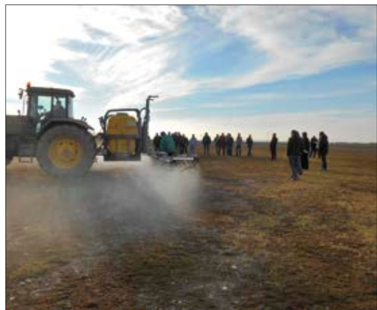
Prosigue la formación a profesionales del campo de la provincia.