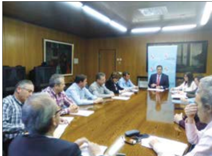
Constitución del consejo agrario zamorano.

Además de contar con el delegado territorial como presidente, el Consejo Agrario Provincial está formado por la vicepresidencia, correspondiente a la jefa del Servicio Territorial de Agricultura y Ganadería, la secretaria, y once vocales, que están representados por cinco funcionarios del Servicio Territorial de Agricultura y Ganadería y seis representantes de las or-