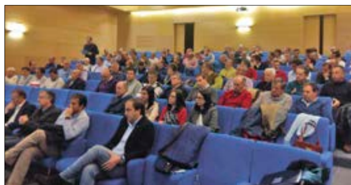
Asistentes a la asamblea, en el salón de Caja España Duero.

servicios y número de ASAJA-Salamanca. Señaló "la buena sementera" de la provincia "cosa que no se da en el resto de comarcas de la región" así como "los buenos pastos" y deseó que, en esta primavera, haya un aumento de pluvio-