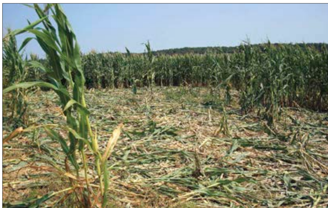
La fauna silvestre plantea continuos y crecientes problemas.

En este sentido desde ASAJA-Burgos reclamamos celeridad a la hora de las autorizaciones para organizar batidas que disminuyan estas pobla-