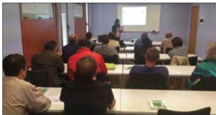
ASAJA-Soria procura que sus socios estén adaptados a la normativa.

A raíz de la conocida como 'crisis de los pepinos', de 2011, la Unión Europea tomó la firme decisión de regular el uso de plaguicidas de uso fitosanitario, para equipararlo a ni-