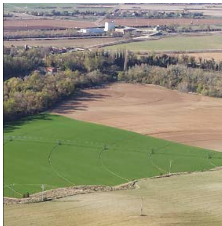
Las escasas reservas de agua condicionan los regadíos.