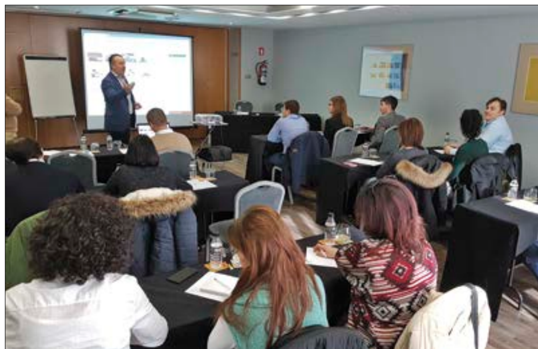
Reunión de los responsables del área de seguros de ASAJA en las nueve provincias de Castilla y León.

El Comité de Evaluación de Riesgos de la Agencia Europea de Sustancias y Mezclas