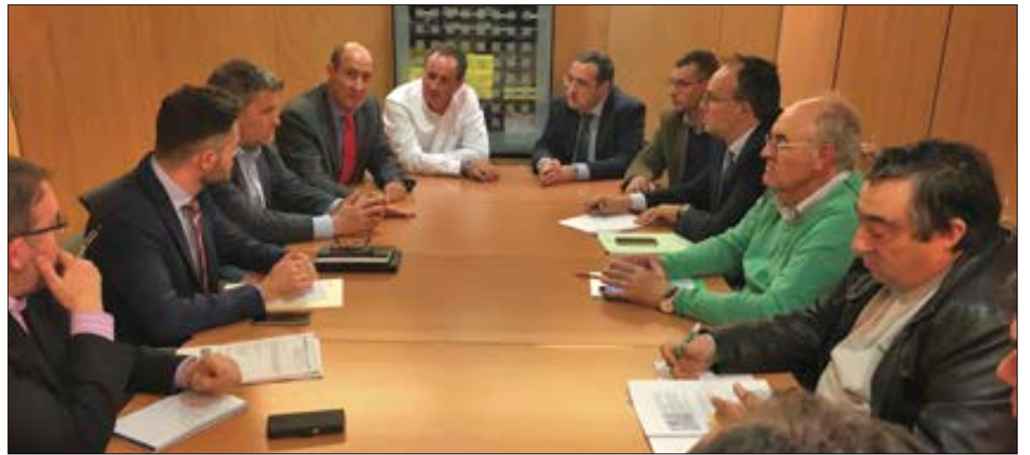
Los diputados socialistas conocieron de primera mano la situación agroganadera de las tres provincias.

Los responsables de ASAJA Teruel, Soria y Cuenca también han reconocido el buen trabajo que se está haciendo desde las federaciones empresariales de estas tres provincias para buscar soluciones al problema de forma global, pero matizan que hay que destacar las especificidades del sector primario, que