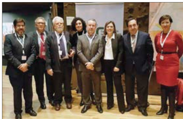
Responsables de ASAJA junto a la consejera de Agricultura y Ganadería.

Cada vez son más los agricultores que conjugan prácticas de agricultura de conservación, como la siembra directa, con la