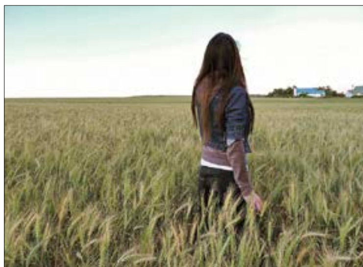
ASAJA demanda más apoyo real.

hace referencia a lo establecido en la Ley 18/2007, disponiendo los mismos beneficios que a los que se dan de alta en la Seguridad Social como familiar del titular de la explotación agraria. En la Ley 31/2015, de 9 de septiembre, por la que se modifica y actualiza la normativa en materia de autoempleo y se adoptan medidas de fomento y promoción del trabajo autónomo y de la Economía Social, se establece la reducción de cuotas a favor de los familiares del titu-