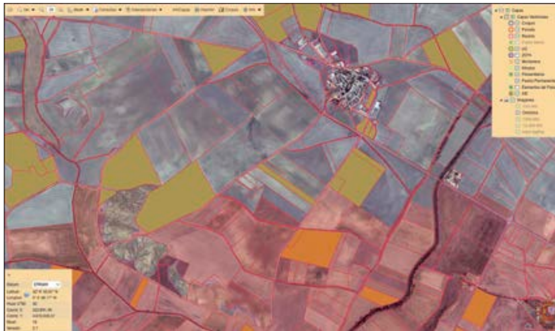
El SigPac, pese a su precisión, no refleja la realidad de muchas parcelas.

Para ASAJA, estos errores se deben principalmente a que la administración se limita a re-