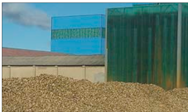
Montones de remolacha junto a la fábrica.

En marzo concluyó la campaña de recolección del maíz en la provincia, y también remataba la de remolacha, recibida en la fábrica de La Bañeza. En el caso del maíz, esta recolección tardía habitual en León, que permite el secado de la planta y evita que tenga que pasar por el secadero, cierra la campaña en toda Europa, pues es difícil encontrar maíz sin recolectar en otras zonas productoras de España y del resto de la Unión Europea. La provincia de León es la principal productora de maíz de España, con una superficie de cultivo destinada a la recolección como grano de 57.800 hectáreas, y una producción estimada de 560.000 toneladas. La campaña que ahora termina se ha caracterizado por unas producciones más modestas de lo habitual debido a los retrasos de las siembras, y unos precios estanca-