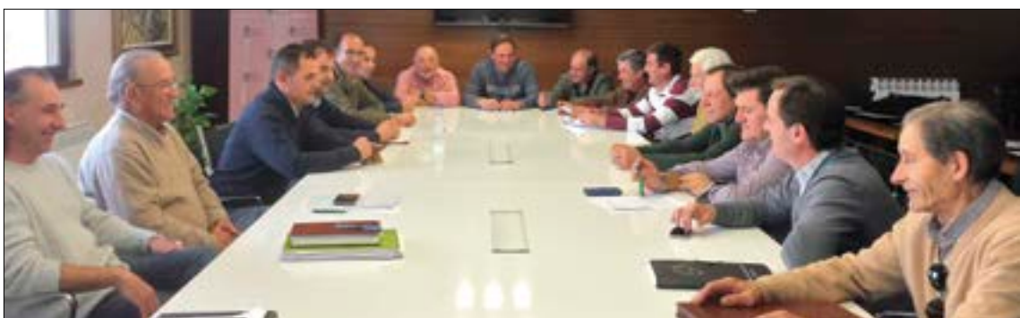
Participantes en la mesa que agrupa a diferentes colectivos en Salamanca.

Los portavoces afirmaron que han aparcado pretensiones diferentes "por llegar a un