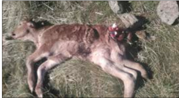
Las muertes de ganado no cesan.

Los ataques de lobo a las ganaderías en extensivo de la provincia de Ávila no cesan. En el mes de marzo se han producido nuevos episodios en diferentes comarcas ganaderas, mientras ASAJA de Ávila insiste en su petición a la Junta de Castilla y León de efectuar controles poblacionales ante el aumento de la presión de los lobos y la multiplicación de las lobadas. A la vez, demanda la actualización de los baremos de las indemni-