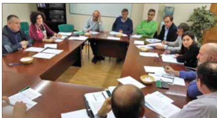
Última Sectorial Remolachera de ASAJA y Confederación en la zona norte.

Las juntas de desembalse y comunidades de regantes analizan estos días las posibilidades, parcas, que este panorama ofrece. "Con las pocas reservas que tienen los pantanos hay que asegurar el abastecimiento a las poblaciones, caudal ecológico, unas reservas mínimas en los embalses y el resto debe destinarse al máximo al riego", apunta Dujo. Los cultivos que pueden verse más afectados por esta situación de sequía son patata, maíz y remolacha, además de la alubia.