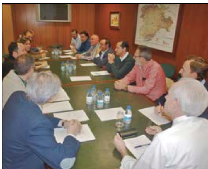
Primera reunión del órgano consultivo provincial.

El Consejo Agrario Provincial informará sobre todos aquellos asuntos específicos en materia agraria y de desarrollo rural que, en el ámbito provincial, sean sometidos a su consideración; podrán efectuar las sugerencias que se consideren convenientes respecto a aquellas políticas que puedan afectar a las condiciones socioeconómicas de la actividad agraria en la pro-