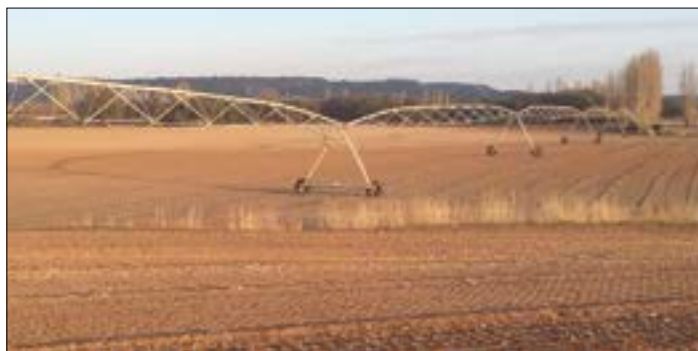
ASAJA defiende que se puedan rotar las tierras regadas.

Los agricultores que tienen concesiones de aguas subterráneas a través de cap-