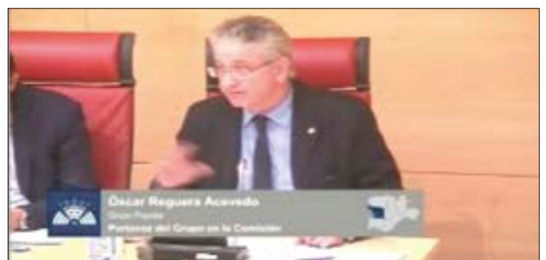
Arriba, el procurador del PSOE; abajo, el portavoz del PP.