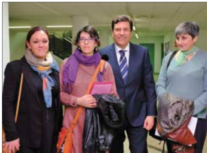
El consejero de Empleo, con las mujeres participantes.

Con esta iniciativa de hacer público este conocimiento y experiencia, a través de estas