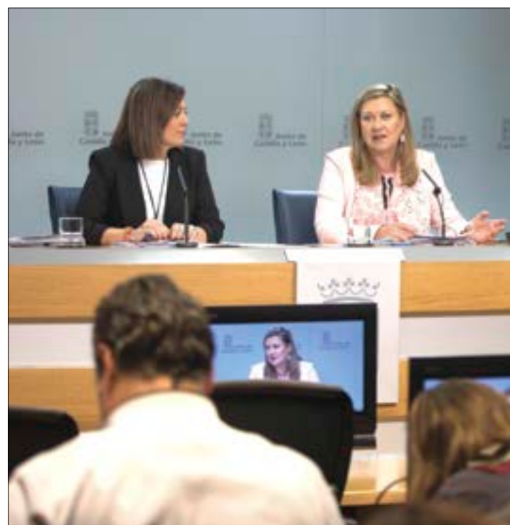
Las consejeras de Agricultura y Ganadería y de Economía y Hacienda.

Otra de las modificaciones fiscales que introduce el anteproyecto tiene que ver con la deducción para el fomento del emprendimiento, que permite a los contribuyentes desgravarse el 20 % de las cantidades dedicadas a la compra de acciones o participaciones de empresas de nueva creación o en fase de expansión, siempre que las compañías destinen los recursos a un proyecto de inversión en Castilla y León y amplíen la plantilla de empleados.