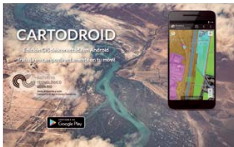
Pantalla de acceso a CartoDroid.

Este sistema es el resultado del trabajo desarrollado por el ITACyL durante más de diez años. En la actualidad hay variedad de aplicaciones de na-