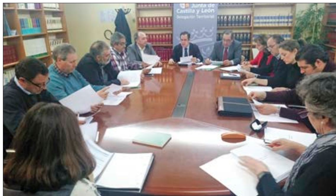
Primera reunión del Consejo Agrario de la provincia de Valladolid.

Este órgano, de nueva creación, permitirá mantener relaciones y negociaciones entre la Administración pública y las principales organizaciones agrarias del ámbito provincial, creando un espacio de diálogo sobre asuntos relevantes de la actividad del sector primario. Con la constitución de estos consejos provinciales se establece, por primera vez, una interlocución