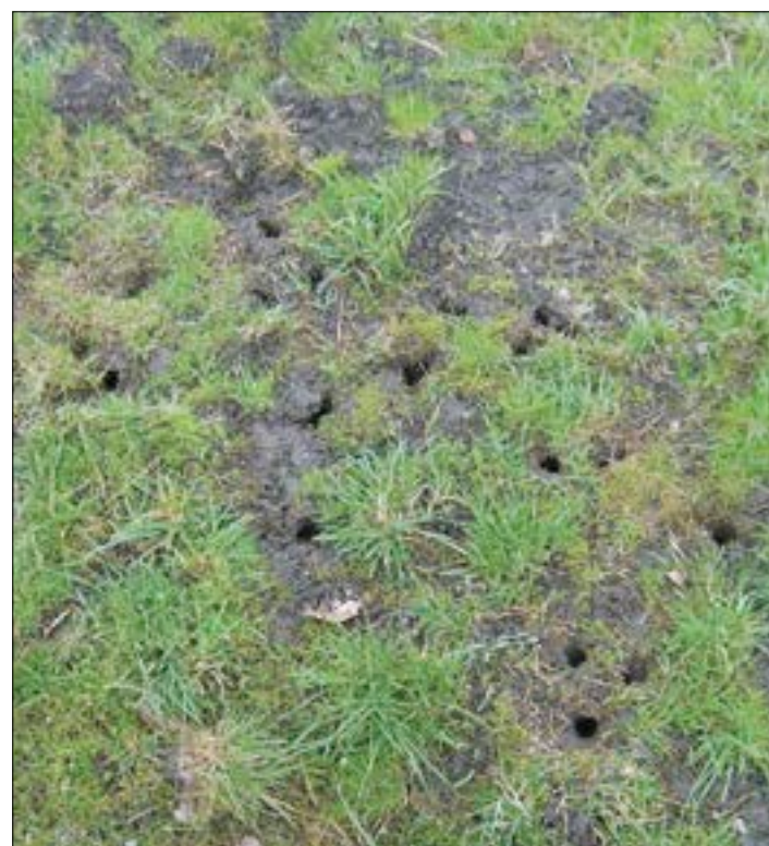
La presencia del topillo, una pesadilla continua para el sector.

Así, en lo que respecta a la siembra, realizar laboreo que implique remoción del terreno a la mayor profundidad posible; nunca realizar siembra directa en parcelas que anteriormente se han dedicado a alfalfa, herbáceos plurianuales, barbecho, pasto;