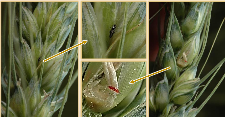
Larvas en tallos seccionados

Adultos y larvas presentan un aparato bucal picador-chupador, inyectando enzimas digestivas al alimentarse para succionar el jugo resultante.