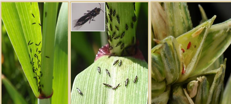
Adultos en la axila foliar y larvas alimentándose del grano en formación