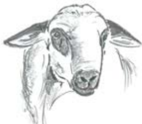
MACHO SIN FOTOGRAFÍA