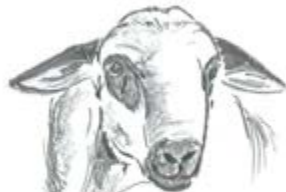
MACHO SIN FOTOGRAFÍA