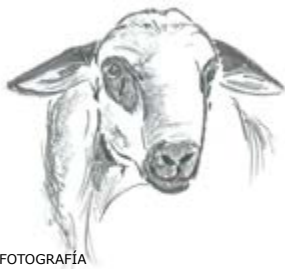
MACHO SIN FOTOGRAFÍA