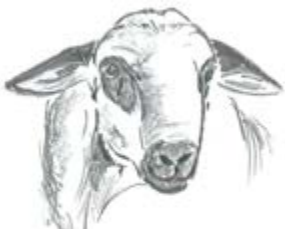
MACHO SIN FOTOGRAFÍA